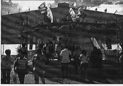
Le 10 ème Forum International de Madagascar (FIM) s'est tenu au Centre de Conférences de l'Orangerie à Paris.

Après 3 années de présence au bâtiment FIM, l'Association Française des Investisseurs et Promoteurs (AFIP) a organisé le 10 ème Forum International de Madagascar (FIM) au Centre de Conférences de l'Orangerie à Paris.