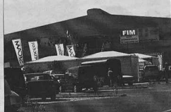
Le Comité d'Organisation de la Foire Internationale de Madagascar (FIM) a été renforcé par la présence de nombreuses institutions internationales.

La détermination du Comité d'Organisation de la Foire Internationale de Madagascar (FIM) a été renforcée par la présence de nombreuses institutions internationales.