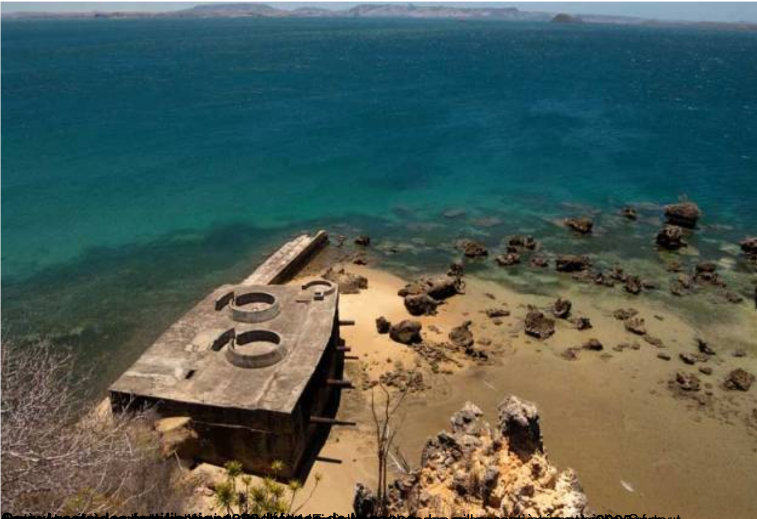
Vue aérienne du fort Orangea, un des nombreux camps militaires de la région.