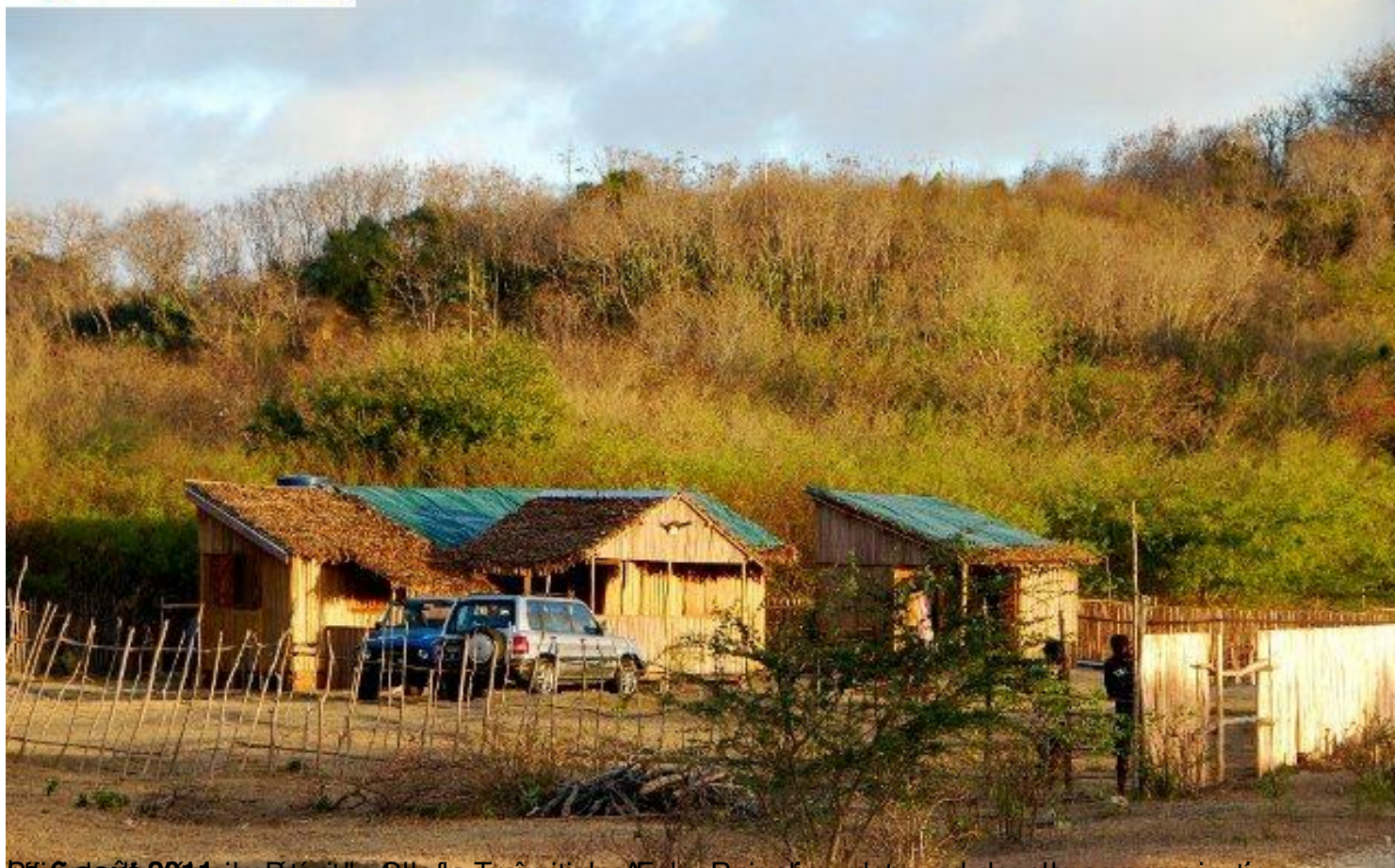
10 août 2011, site Fénasua. C'est la présence des Armes Rajonea, se trouve dans le camp.