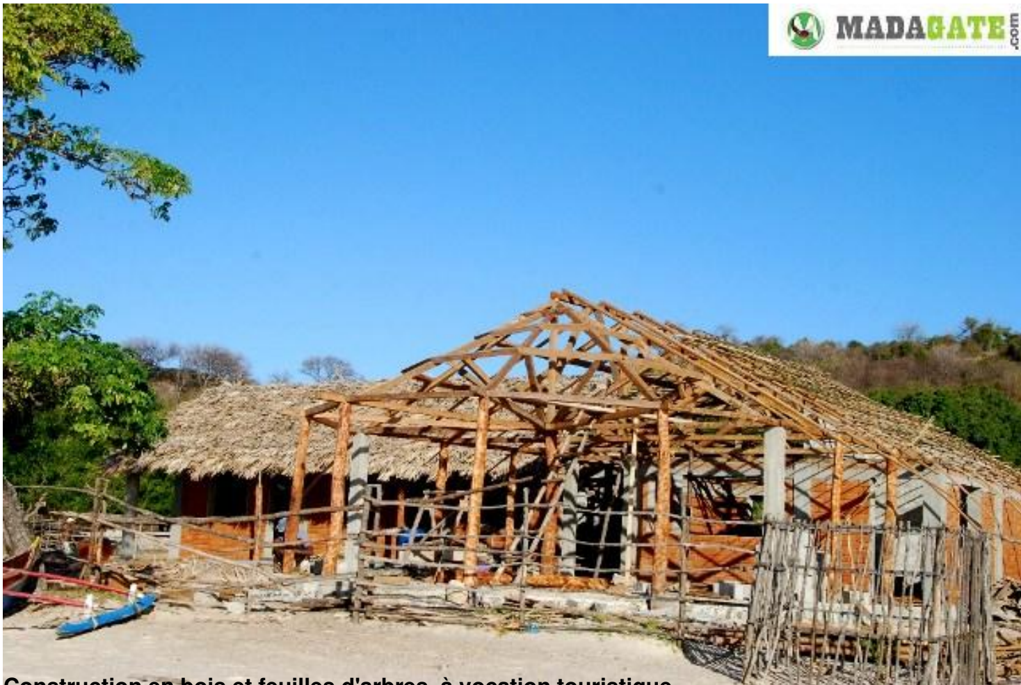
Construction en bois et feuilles d'arbres, à vocation touristique