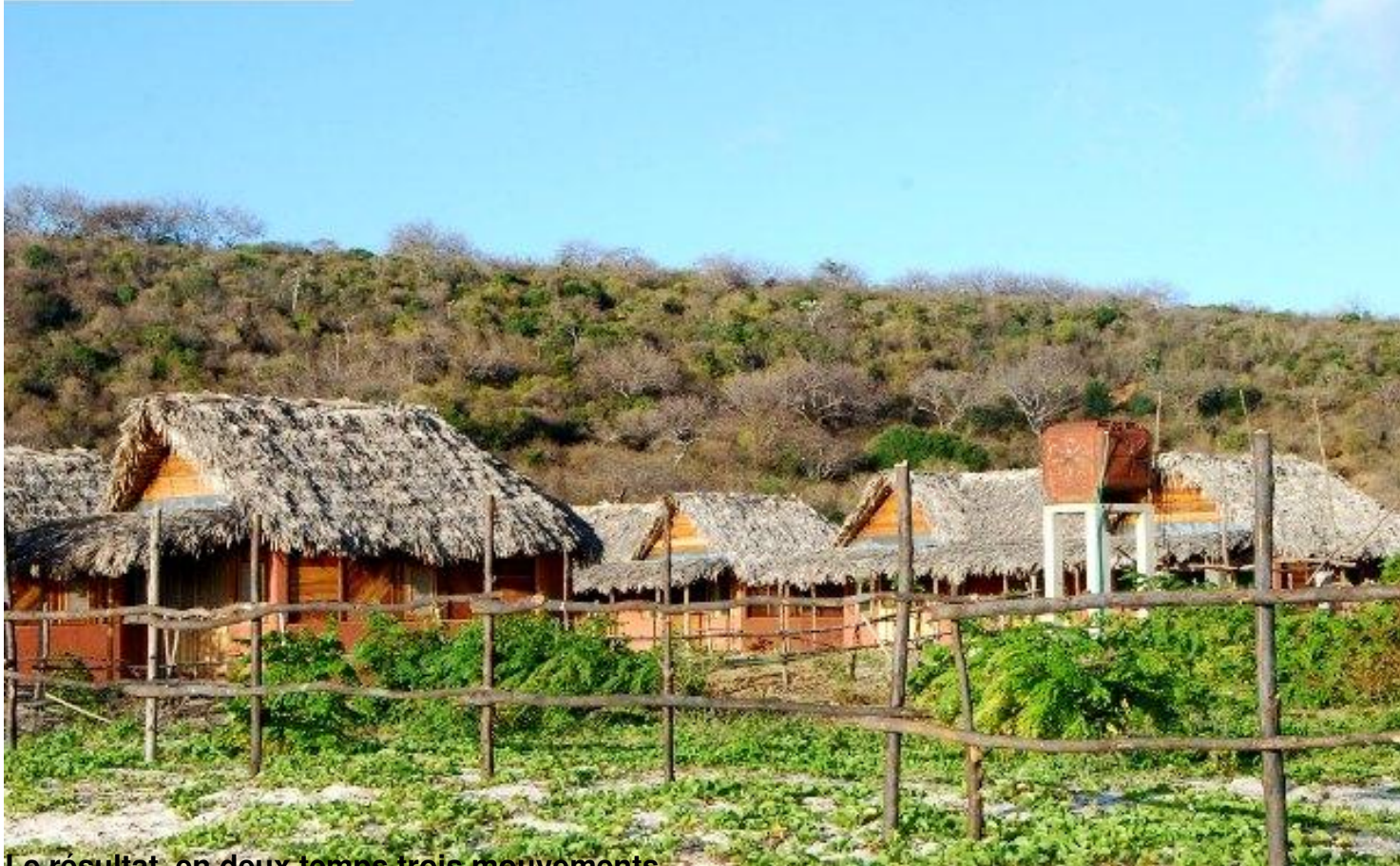
Le résultat, en deux temps trois mouvements...