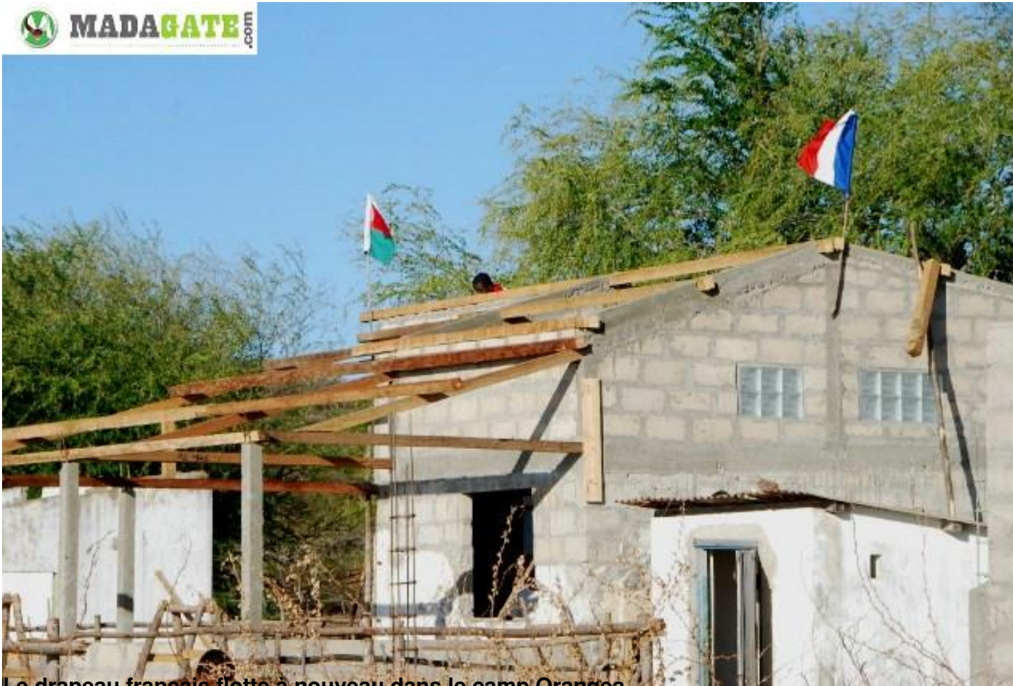
Le drapeau français flotte à nouveau dans le camp Orangea...