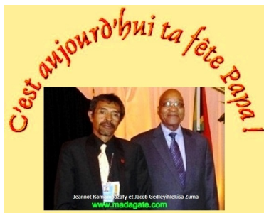
Photo-souvenir avec le Président Sud-africain, pour tous mes enfants et petits-enfants