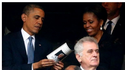
"There are too many people who happily embrace Madiba's legacy of racial reconciliation, but passionately resist even modest reforms that would challenge chronic poverty and growing inequality," Obama said in his most pointed remarks. "There are too many leaders who claim solidarity with Madiba's struggle for freedom, but do not tolerate dissent from their own people. And there are too many of us on the sidelines, comfortable in complacency or cynicism when our voices must be heard." - President Barack Obama -