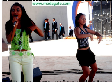
Tanora vao misondrotra mandray anjara am-pitiavana