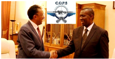
L'ombre de C.O.P.S entre G.I. Jao et Oliver Rendcontent

Ben quoi, ils ne cessent de parler de combat contre on-ne-sait-plus trop bien quoi, étant donné que tout perdure et le peuple malgache se meurt: insécurité; délestage devenu coupure systématique et quotidienne; accaparement de terrains par des étrangers; coût de la vie battant des records de saut en hauteur entraînant une pauvreté généralisée.