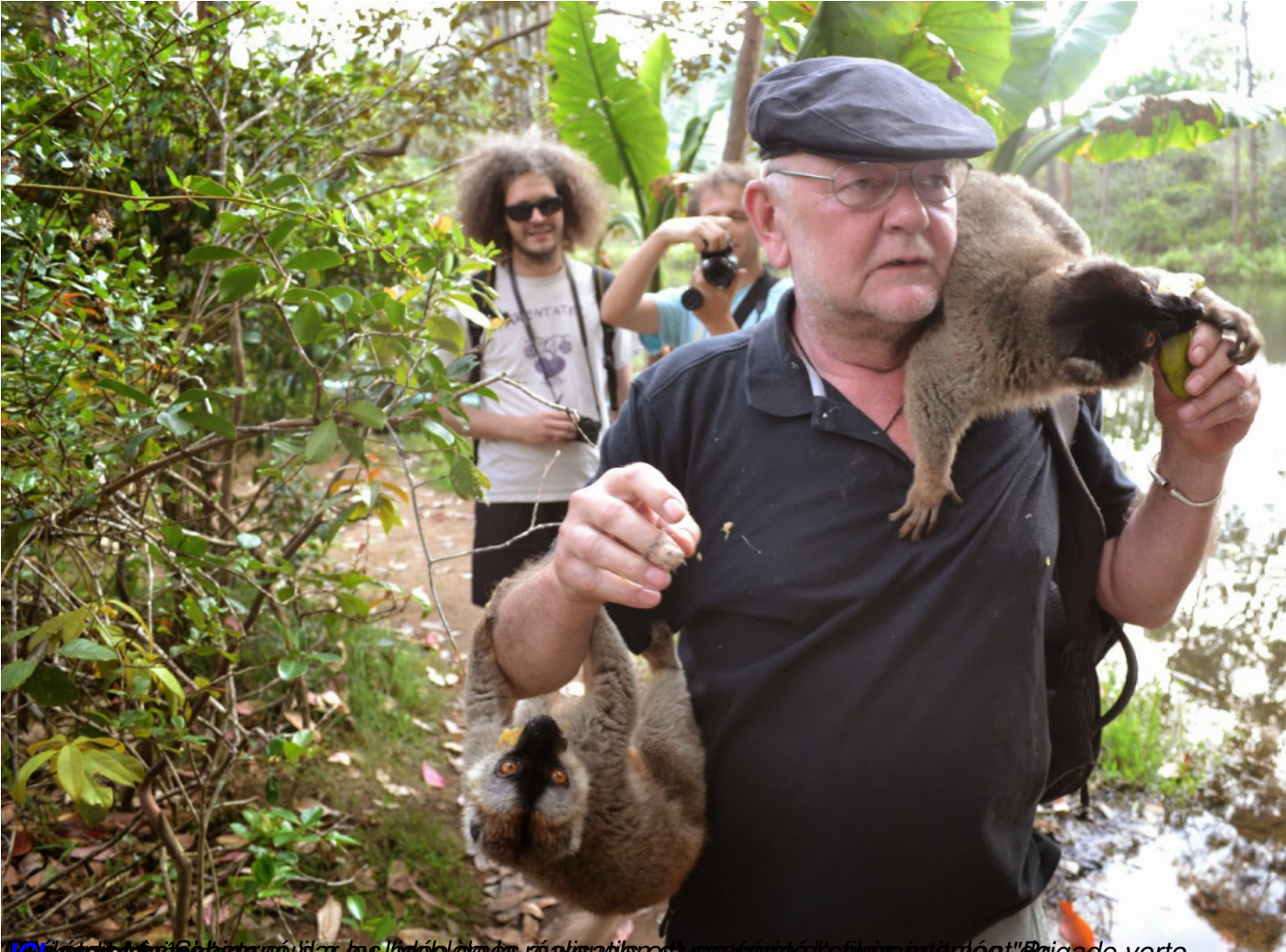
Le 13 Octobre 2017, à Madagascar, les journalistes réalisent une séance de photos intitulée "Brigade verte"