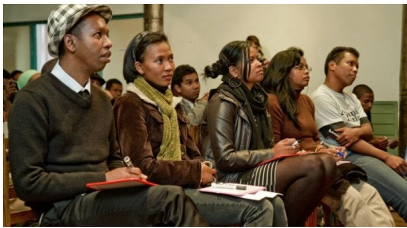
Cours d'allemand au CGM