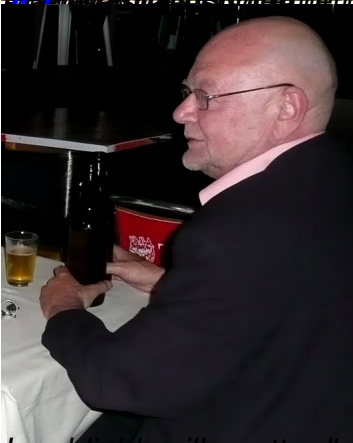
Inoubliable silhouette d'un... bon vivant