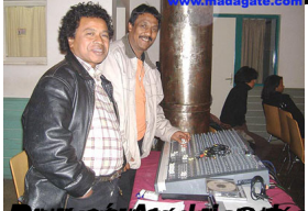
Primatierina qui nous a invité le 27 novembre 2019 à l'occasion de la Journée de la Femme