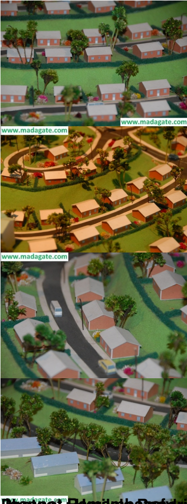
Beanosy Raaraha Pariry Anararison