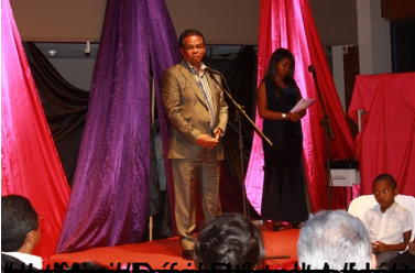
au cours de la cérémonie de la remise des prix de la Région Analamanga, organisée par le Centre de Formation et de Recherche de la Région Analamanga.