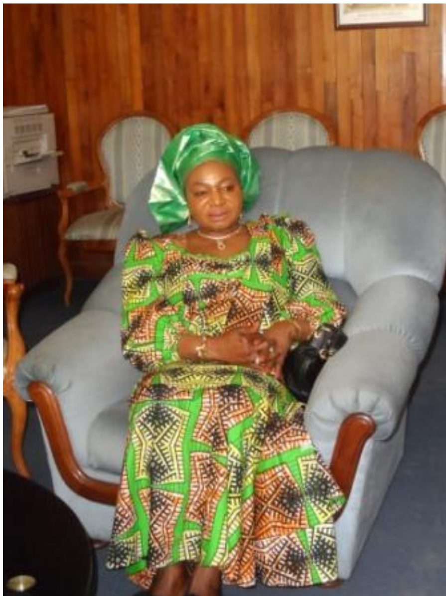
Sem Matilda Kwashi Mon, Ambassadeur du Nigeria auprès de la République de Madagascar