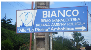
Foto-kevitra ijoroan'ny fanadihadiana ataon'ny BIANCO