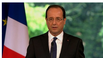
Le Président français, François Hollande

CLIQUEZ ICI POUR L'ALBUM DE PHOTOGRAPHIES