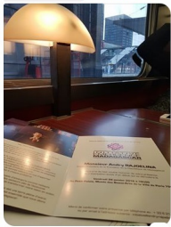
16h10 à la gare Lille Flandres