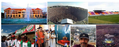
Exemples d'infrastructures réalisées ou en cours de réalisation : Hôtel de ville d'Antananarivo ; stade Makis d'Andohatopenaka ; Coliseum d'Antsonjombe ; Palais de la Reine du Rova de Manjakamiadana ; des dizaines d'hôpitaux, d'établissements scolaires et de stades et complexes sportifs manarapenitra construits à travers tout le pays ; Stade Barea de Mahamasina Antananarivo ; Stade manarapenitra de Barikadimy à Toamasina ; prison d'Imerintsiosika...

de cette partie de l'île, grâce au projet « Ceinture Verte » visant à lutter contre la désertification et à appuyer la résilience au changement climatique. « C'est une promesse solennelle que je fais aujourd'hui afin de sortir le Grand Sud de la pauvreté. C'est grâce à cet engagement inédit, aux efforts communs que nous allons changer le destin du Grand Sud de Madagascar » , a déclaré le Président Andry Rajoelina.