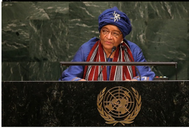
Sirleaf's father was Gola and her mother had mixed Kru and German ancestry. While not in fact Americo-Liberian in terms of ancestry, because of her parents' upbringing and her own education in the West, Sirleaf is considered to be culturally Americo-Liberian, or assumed to be Americo-Liberian. Abon. Site internet de la presse écrite nationale. Le quotidien du Sport