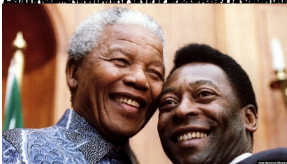
Le Président Nelson Mandela et Edson Arantes do Nascimento, alias le footballeur Pelé, en 1985.