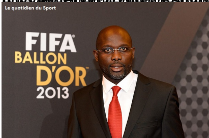
George Weah, seul joueur africain sacré Ballon d'or par la FIFA, élu Président de la République de Libéria le 26 décembre 2013.