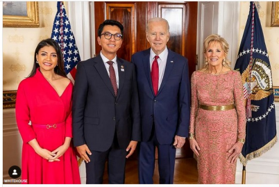
Miały et Andry Rajoelina avec Joe et Jill Biden, à la Maison-Blanche en décembre 2022