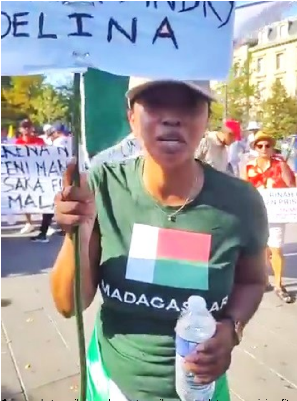
Manay sady tsy mila vazaha no tsy mila mpangalatra eo amin'ny fitondrana !