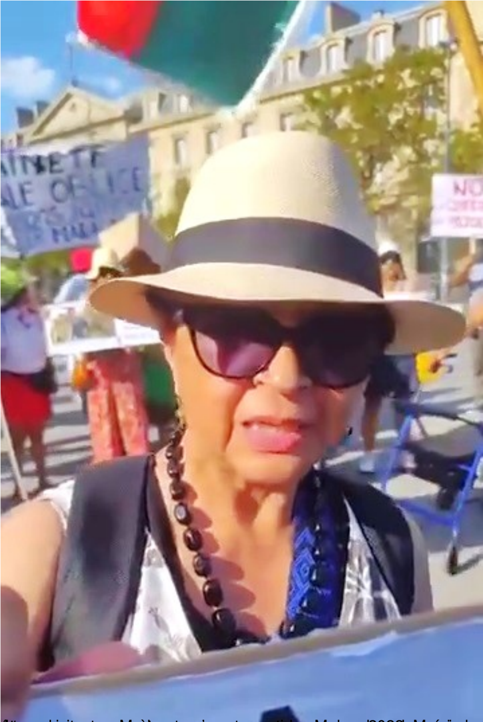
44e anniversaire Malagasy aorete an'ireo Malgache 2023. Le période de la décolonisation, ça doit