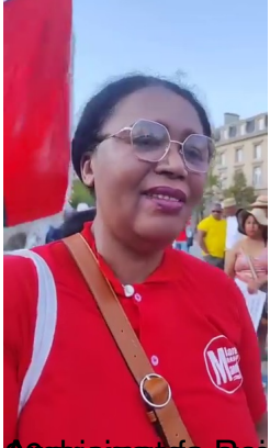
2012: ajaza Rajoiny an'ny Vava Rajoiny tsinany Malagasy ka entany! Malagasy.