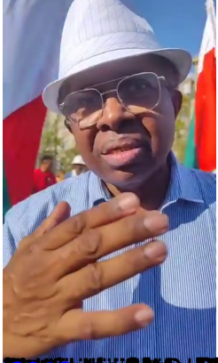
Tena Malagasy ka ny hafa hainoizany.