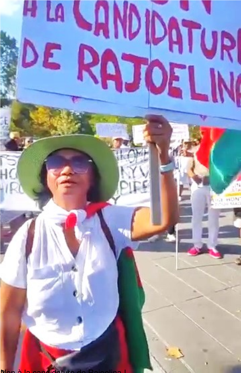
Bon à la candidature de Rajoelina !