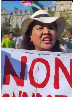
Rano-belo an'idey ireo heu... Rajoelina... (inaudible) tena mandehan mi-dégage, mandehana