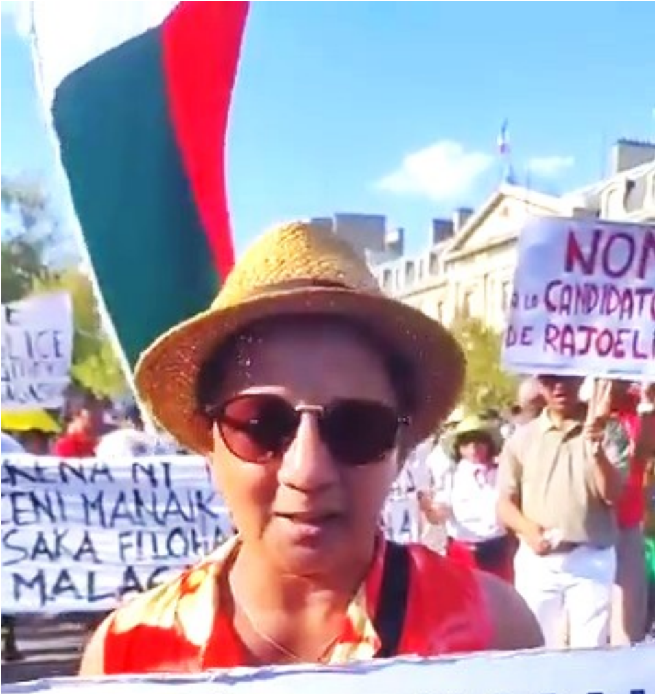
Rajolainha.: miala ianao tsisy atakandro, ianao sy ny forongonao ireo. Mijaly ny vahoaka, maty