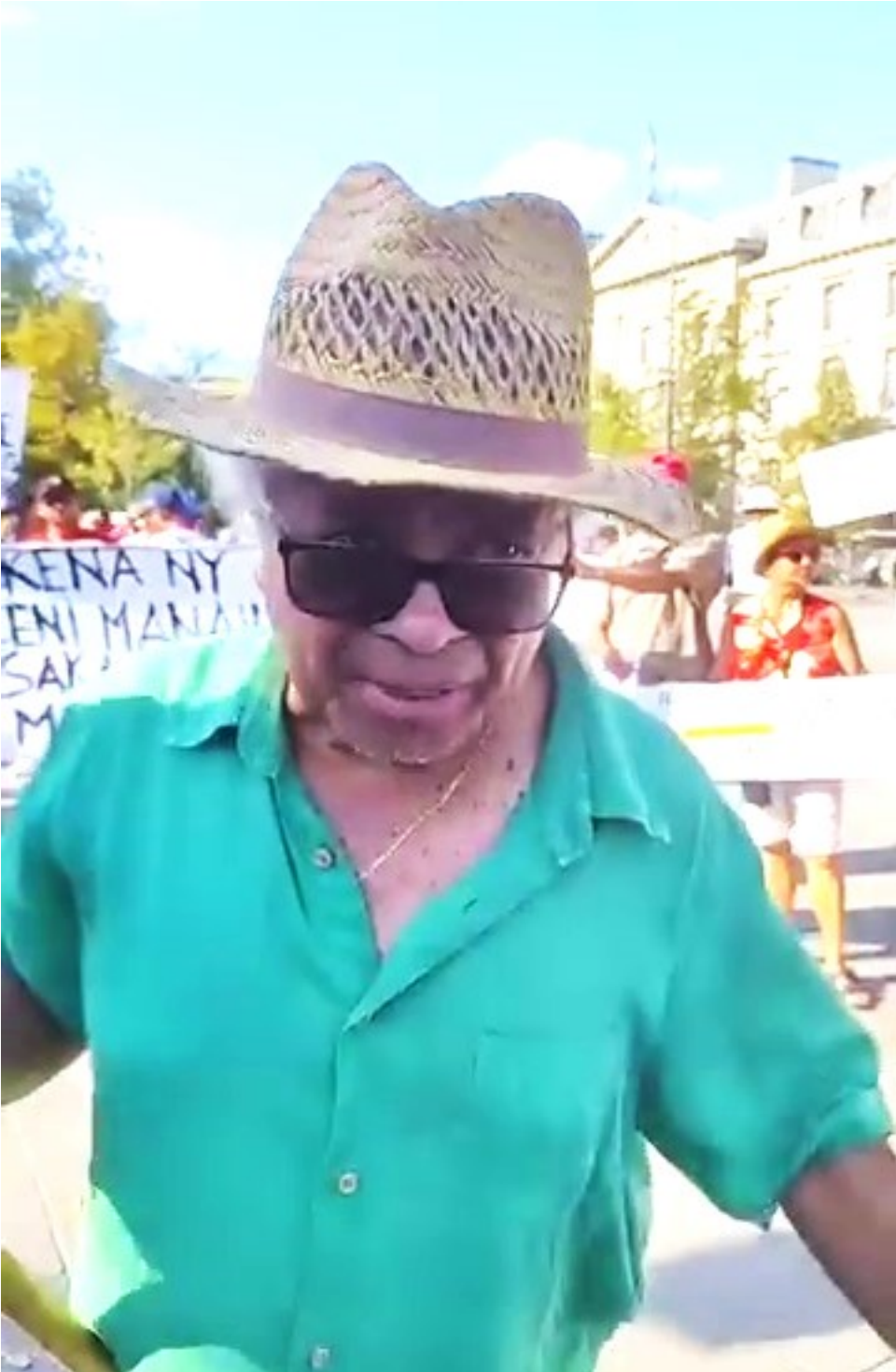
Mpandika lalàna i Rajoelina ! Miala Rajoelina ! Tsy mila an'i Rajoelina !