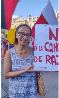
2010: palahelofantsy lajandry Malagasy jiolitsy. Ho Cno azydy volabe mihitsy