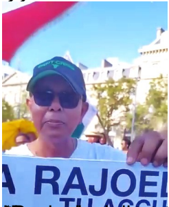
2009: izaho tsy mila président gasy fa manana président frantsay. Izay.