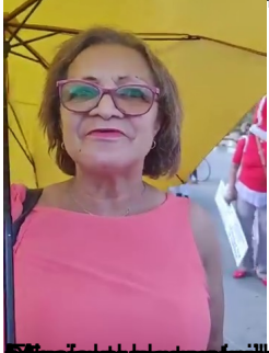
2011: @pibibinika Malagasy galy Fanirisoa Malagasy, Tsimanitra @may