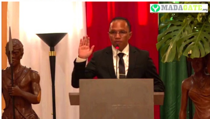
Fidiniavo Ravokatra, ministre de l'Eau, de l'Assainissement et de l'hygiène