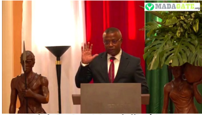
Tokely Justin, ministre de l'Intérieur