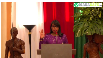
Rindra Hasimbelo Rabarininarison, ministre de l'Economie et des Finances