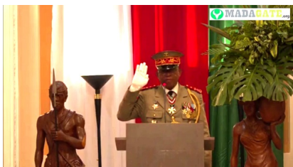
Général de Division Sahavelo Lala Monja Delphin Sahavelo, ministre des Forces armées

Ary raha tsy tanteraka ny asa sy ny fanamby nankinina amiko dia hametra-pialàna avy hatrany aho. Tsy hanao kolikoly ary manaiky fa ho enjehina sy ho ahitsy araky ny lalàna manan-kery raha sanatria manao izany.