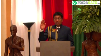
Zely Arivelo Randriamanantany, ministre de la Santé Publique