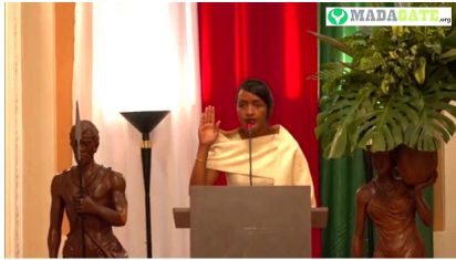
Rasata Rafaravavifika ministre des Affaires Etrangères