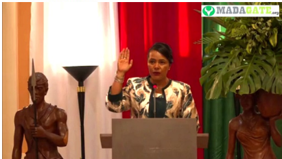
Haingo Elisette Fomendrazo, ministre de la Population et des Solidarités