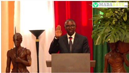
Suzelin Ratohiarijaona Rakotoarisolo, ministre de l'Agriculture et de l'Elevage