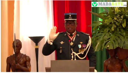
Colonel Ndrimihaja Livah, ministre des Travaux publics