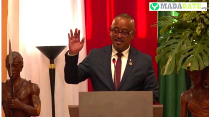
Haja André Resampa, ministre de la Jeunesse et des Sports