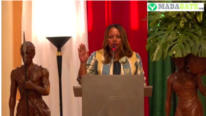
Hanitra Fitiavana Razakaboana, ministre du Travail, de l'Emploi et de la Fonction publique