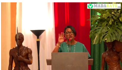
Landy Mbolatiana Randriamanantenasa, ministre de la Justice, Garde des Sceaux