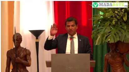
Tahina Razafindramalo, ministre du Développement numérique, des Postes et des Télécommunications