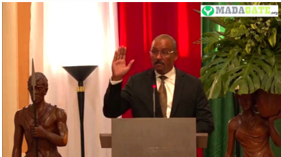
Olivier Jean-Baptiste, ministre de l'Energie et des Hydrocarbures