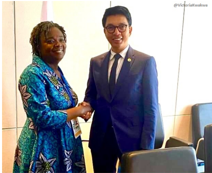
Addis-Abeba, 18 Febroary 2024. Rtoa Victoria Kwakwa sy ny Filoha Andry Rajoelina

Addis-Abeba, Alahady 18 Febroary 2024. Teo akilan'ny andro faran'ny Fivoriana tsotra faha-37 ho an'ireo mpitondra firenena sy mpitondra fanjakana afrikana mivondrona ao anatin'ny Firaisam-be afrikana (UA), dia nihaona indray tamin'i Ramatoa Victoria Kwakwa, ny Filoha Andry Rajoelina,