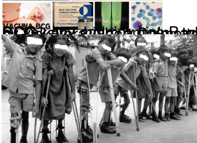
Ankizy tsy natao vaksiny fony zaza, tratry ny lefakozatra na "poliomyélite"