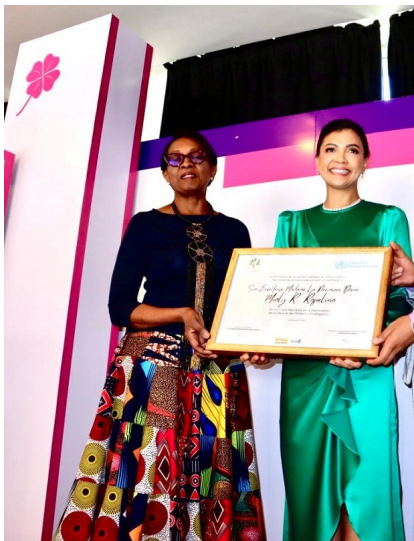
Félicitations chaleureuses, à Madame Mialy Rajoelina, Première Dame de Madagascar, pour avoir défendu les efforts visant à garantir que les enfants de tout le pays reçoivent les vaccinations essentielles. Appréciée l'initiative visant à protéger la santé des enfants, offrant ainsi à la prochaine génération la possibilité de s'épanouir ! Antananarivo, le 26 avril 2024 Dr Matshidiso Moeti Directrice Régionale de l'Organisation mondiale de la santé (OMS) pour l'Afrique

Inona no antony tokony -ary tsy maintsy- hanaovana vaksiny ny zaza malagasy ? Fanazavana nomen'ny vadin'ny Filoham-pirenena, Mialy R. Rajoelina, ny zoma 26 avrily 2024 tao Antanimenabe Ankorondrano Antananarivo. Tsiahiviny fa izy dia reny mpiahy ny fanaovana vaksiny nanomboka ny taona 2019, eo ambanin'ny fiahian'ny OMS (Fikambanana maneran-tany momban'ny Fahasalamana) ary mbola notohizin'ity farany io andraikitra io noho ny fitokisany an'ny Première Dame Mialy Rajoelina.