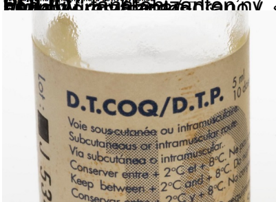
D.T.COQ = Mifika la gasy (Diphakia), Tétanosy, Coquelache amin' (Difteria), Terao tsy ny Kohadavareny