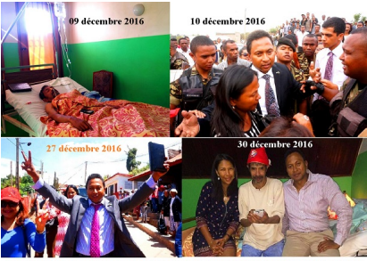
MADAGATE.ORG VOUS SOUHAITE UNE BONNE ET HEUREUSE ANNEE 2017. CELLE DE LA REDEMPTION POUR LES UNS, DE LA PUNITION POUR D'AUTRES ...