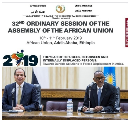
Le Président de l'Égypte, Abdel Fattah El-Sissi, et le Président du Rwanda, Paul Kagame

Les 10 et 11 février 2019, aura lieu au « Nelson Mandela Hall, AUCC, à Addis-Abeba en Éthiopie, le 32ème sommet ordinaire des chefs d'État et de gouvernement des pays membres de l'Union africaine, dont le thème sera :