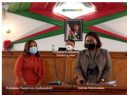
Liste définitive des candidats retenus à l'élection des représentants du Sénat pour devenir membres de la HCC durant un mandat de 7 ans