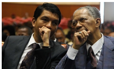
Les Présidents Andry Rajoelina et Didier Ratsiraka au CCI Ivato en 2019

Décédé le 28 mars 2021, l'ancien président de la république, Didier Ignace Ratsiraka, sera inhumé au Mausolée d'Ambohitsaina à Antananarivo le 29 mars 2021 officiellement décrété journée de deuil national par le président Andry Rajoelina.