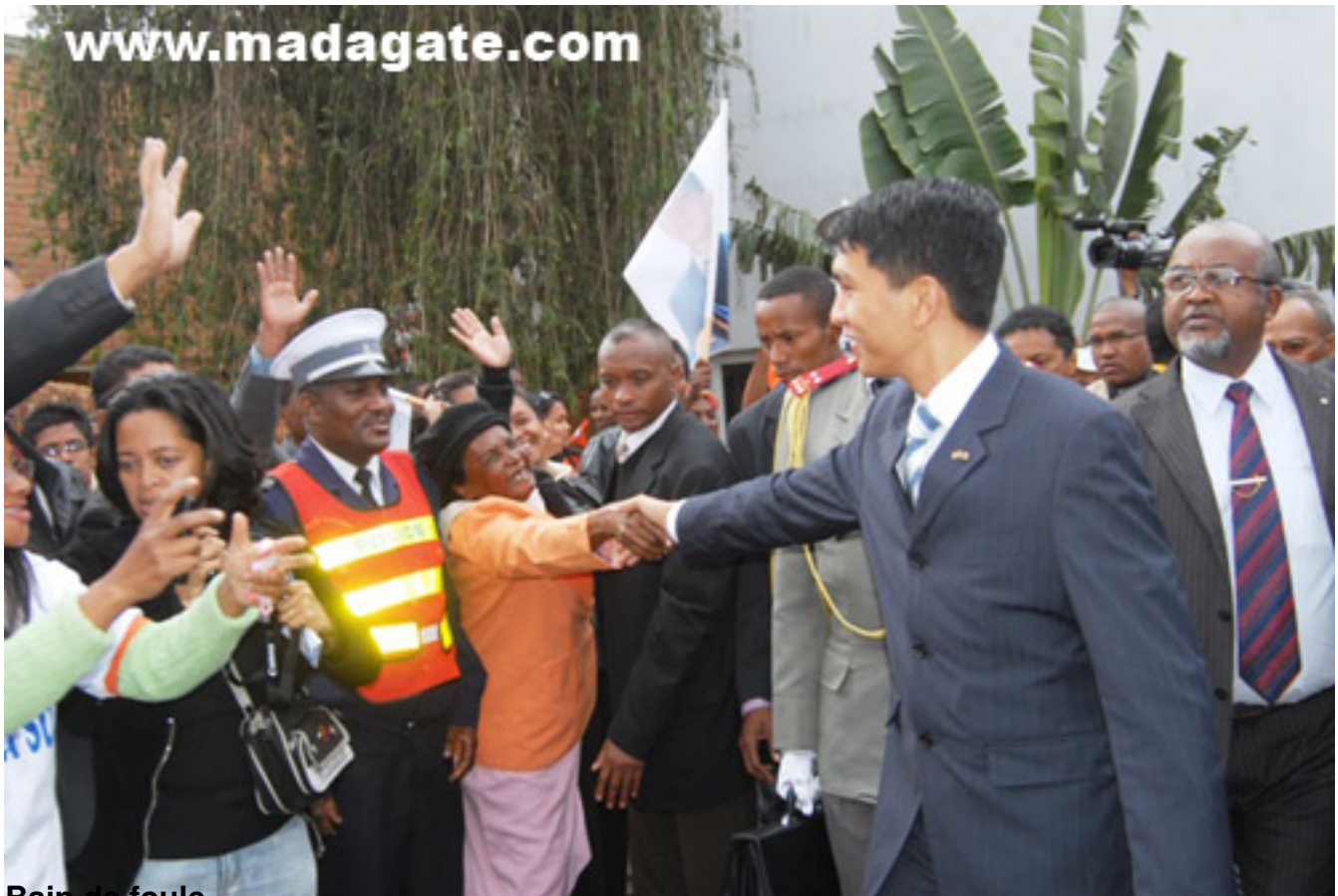
Rein de foule