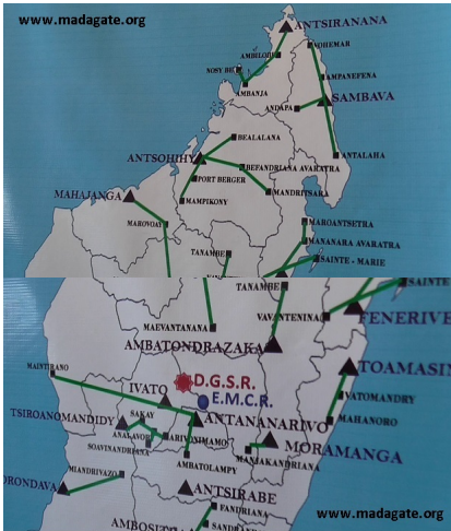
E.M.C.R. = Equipe mobile de contrôle sur route