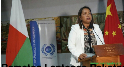
Ramatoa Lantsoa Rakotomalala, ministry ny Indostria sy ny Varotra