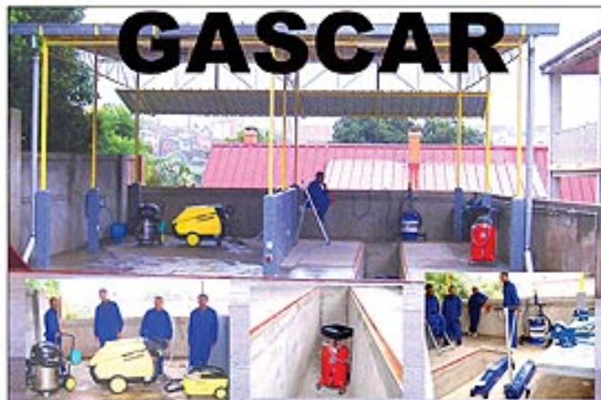
Professionnalisme - Qualité - Haute technologie - Rapidité