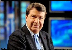
Xavier Darcos L'art d'apprendre à ignorer

Venus d'Italie, les Romains , commandés par Jules César , envahissent la Gaule. Vercingétorix , chef des Gaulois, veut les chasser mais il est vaincu à Alésia en 52 avant Jésus Christ . La Gaule devient romaine.