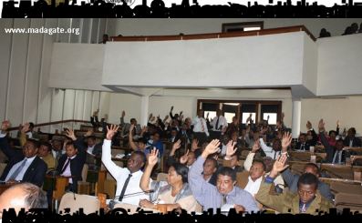
MONSIEUR LE PRÉSIDENT DE LA RÉPUBLIQUE A LA PAROLE