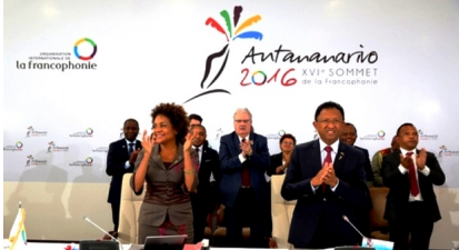
Le Président Hery Rajaonarimampianina et le Président de la BAD