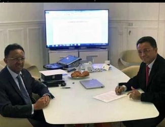
Paris (France), 10 Desambra 2019. Nikaosy azy filoha teo aloha, Hery Rajoanarimampianina sy Marc Ravalomanana. Tadio fa ny voalohany dia banagadra ny fakarao tany Antsiranan'ny taona 2014. Izany no faovana politika eto Madagasikara. Tombontsoa ilany, tombontsoa...