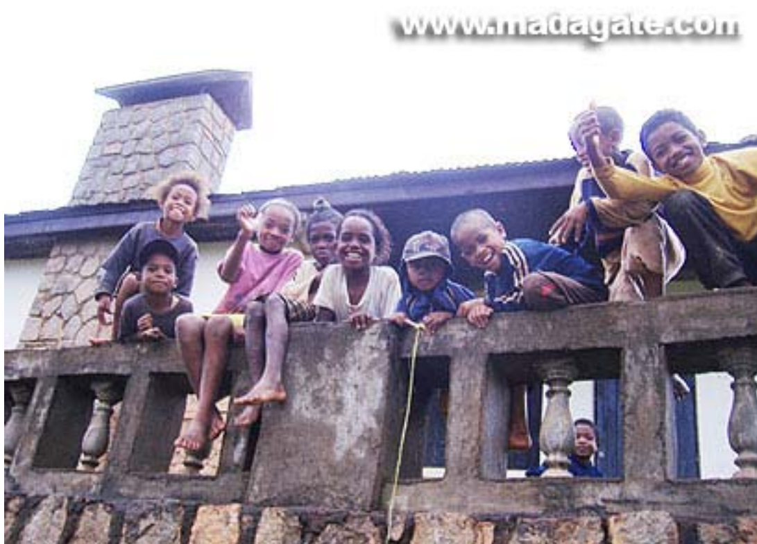
Couramment, cette photo d'enfants, prise de près, de village pauvre à Miraflores, a été utilisée