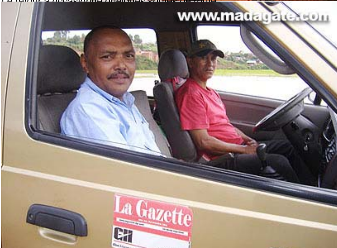
Jusqu'à chez Salomon de la Gazette de la Grande Île et le driver qui a tenu à me raccompagner