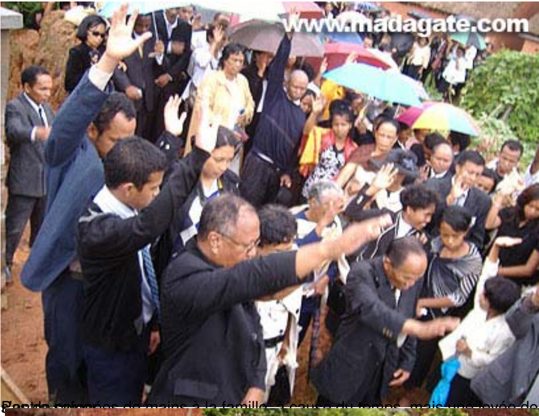
Écoute silencieuse de mains à la famille... cause du temps, mais une levée de main pour