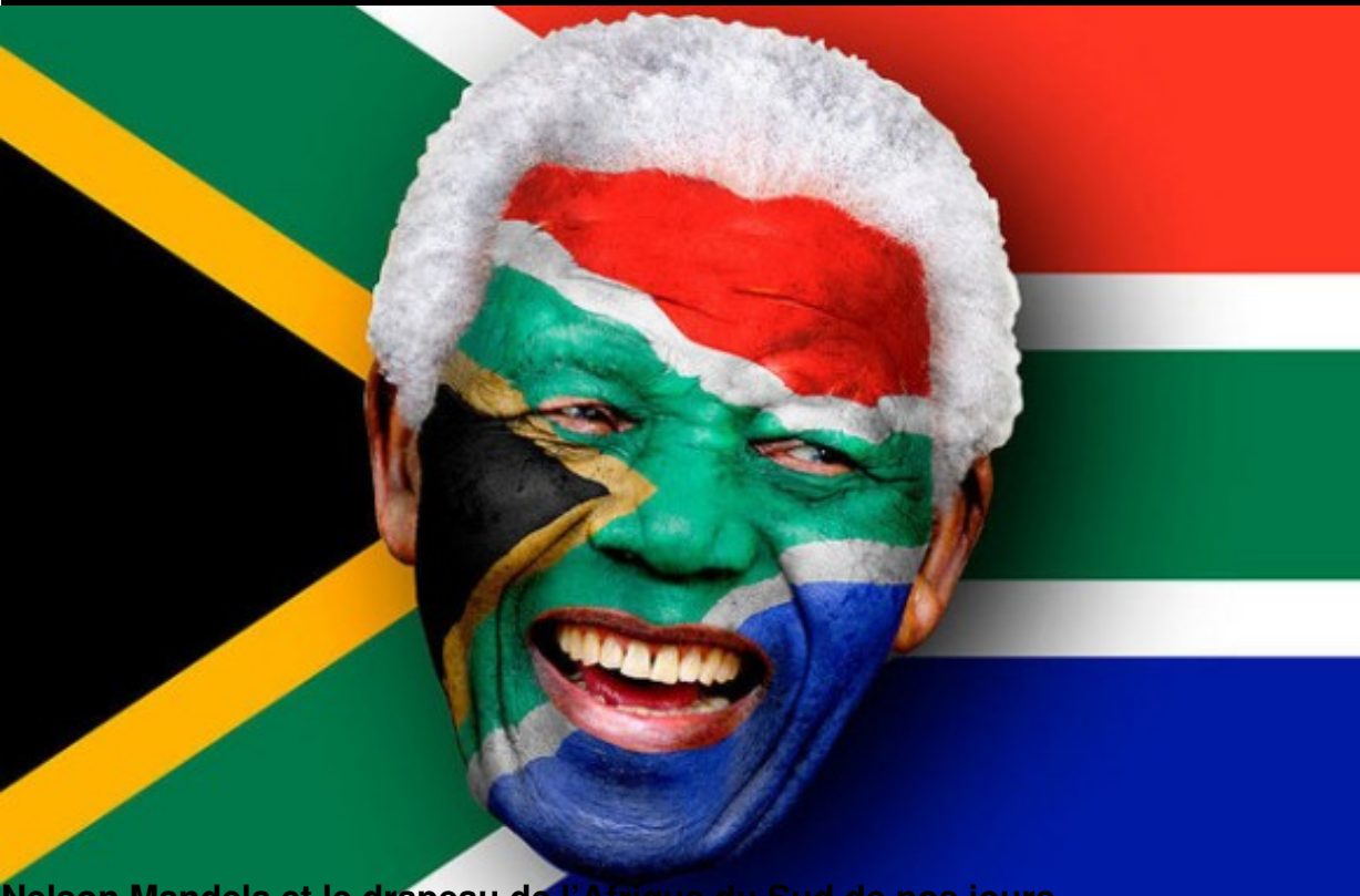
Nelson Mandela et le drapeau de l'Afrique du Sud de nos jours