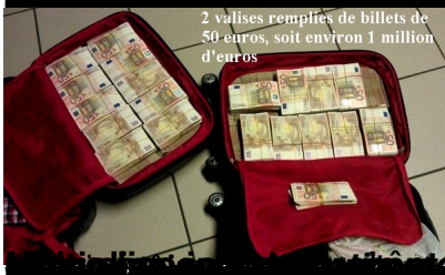
2 valises remplies de billets de 50 euros, soit environ 1 million d'euros

Travelling with €10 000 or more? No problem – make sure you declare it to customs before entering or leaving the EU.