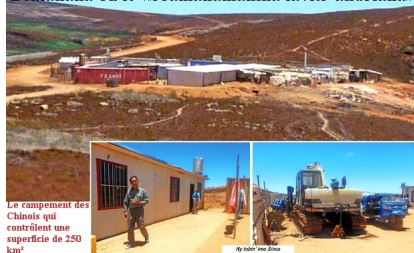
Le campement des Chinois qui contrôlent une superficie de 250 km²

Un drame socio-écologique sous l'œil complice des autorités. Le cas de Soamahamanina n'est nullement isolé car il semble bien qu'il s'agit de la partie émergée d'un gigantesque iceberg d'un système d'État de non-droit généralisé. La population de Bealanàna, bourgade située à 70 km de la Capitale, en opposant une farouche résistance à l'exploitation aurifère d'une société chinoise sur la Terres-de-leurs-Ancêtres (Tanindrazana), et en même temps terre nourricière, a suscité des vocations pour d'autres population dans des contrées lointaines où l'on observe la même situation, avec pratiquement les mêmes ingrédients.