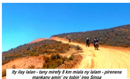
Ity ilay lalan - tany mirefy 8 km miala ny lalam - pirenena mankany amin' ny tobin' ireo Sinoa

* Bientôt en ligne la vidéo du reportage sur place, sous-titrée en français