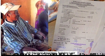
Solo fpankavina' Ambarofana, Tanjilona Lavot