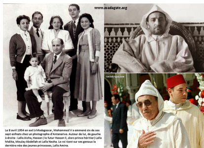
Roi Mohammed V du Maroc. Les vraies raisons de son exil en Corse et à Madagascar

Lundi, 21 Novembre 2016 09:06 - Mis à jour Lundi, 21 Novembre 2016 11:36