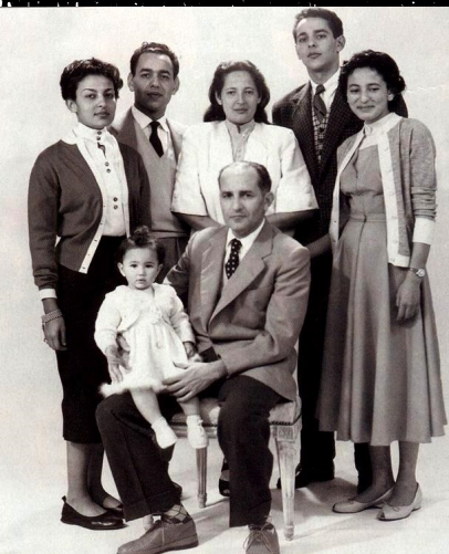
Le 8 avril 1954 en exil à Madagascar, Mohammed Va emmené six de ses sept enfants chez un photographe d'Antanarivo. Autour de lui, de gauche à droite : Lalla Aïcha, Hassan (le futur Hassan II, alors prince héritier) Lalla Malika, Moulay Abdellah et Lalla Nezha. Le roi tient sur ses genoux la dernière née des jeunes princesses, Lalla Amîna.