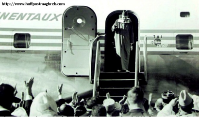
Alors que le Maroc lutte pour son indépendance, le gouvernement français décide d'envoyer en exil le sultan Sidi Mohammed ben Youssef pour tenter de mettre fin au mouvement. C'est le début d'un long voyage forcé.

Lundi, 21 Novembre 2016 09:06 - Mis à jour Lundi, 21 Novembre 2016 11:36