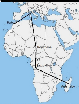
Itinéraire de l'exil du Sultan, futur Mohammed V Roi