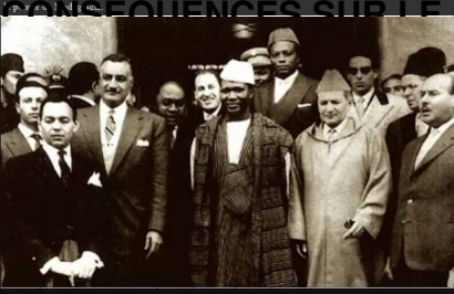
Les Leaders d'origine du Groupe de Casablanca, pour la construction de l'Unité Africaine.

Cette photo est historique à plus d'un titre. Elle a été prise à la sortie de la réunion du Groupe de Casablanca pour la construction de l'Unité africaine, en 1961. Cette réunion avait lieu dans l'ancienne préfecture de Casablanca, Place Mohammed V.