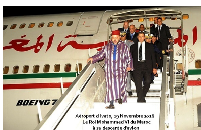
Aéroport d'Ivato, 19 Novembre 2016 Le Roi Mohammed VI du Maroc à sa descente d'avion

C'est fou, mais ce régime Hvm/Rajaonarimampianina a une drôle de manière d'écrire l'Histoire. Sur le site de la présidence de la république de Madagascar, vous lirez: « La visite du Roi Mohammed VI consacre le renouveau dans les relations entre le Maroc et Madagascar. Les deux pays ont été rapprochés par l'Histoire dans les années 1950. Dans l'élan de la lutte pour l'indépendance, Feu le Roi Mohammed V, grand-père du Souverain, avait été envoyé en exil avec sa famille en août 1953 par le pouvoir colonial français; d'abord en Corse puis à Madagascar, à partir de janvier 1954, dans la ville d'Antsirabe où il avait résidé à l'hôtel des Thermes pendant un peu plus de deux années. Ce n'est qu'en novembre 1955 que Feu le Roi Mohammed V a pu revenir, triomphalement, au Maroc qui allait alors recouvrer son indépendance en mars 1956 »