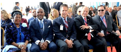
From left to right: Sheila Jackson Lee (US Representative, Democrat, Texas); Greg Meeks, US representative, Democrat, New York); Mike Bishop, US Representative, Missouri); ; Steven King (US Representative, Democrat, Iowa) Blake Farenhold, US Representative, Democrat, Texas)

Tsy adino ny fanajàna ny atao hoe Demokrasia.