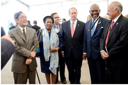
From left to right: Robert Yamate (US Ambassador); Sheila Jackson Lee (US Representative, Democrat, Texas); Blake Farenhold, US Representative, Democrat, Texas); Robert Goodlatte (US Representative, Virginia); Greg Meeks, US representative, Democrat, New York); Steven King (US Representative, Democrat, Iowa)

Mbola tsy nisy mpitondra mpandainga sy tsy miraharaha vahoaka toa ireto Hvm ireto mihitsy teto Madagasikara, hatramin'izay niainako. Ary efa ela nihetezana aho fa tsy zaza vao omaly akory. Manana ny tombontsoany eto tokoa aloha ny Etazonia, toa ireo firenena matanjaka rehetra aty Afrika. Kanefa, tsy misangy mihitsy ry zareo rehefa resaka fitondra tsara tantana (« Bonne gouvernance »