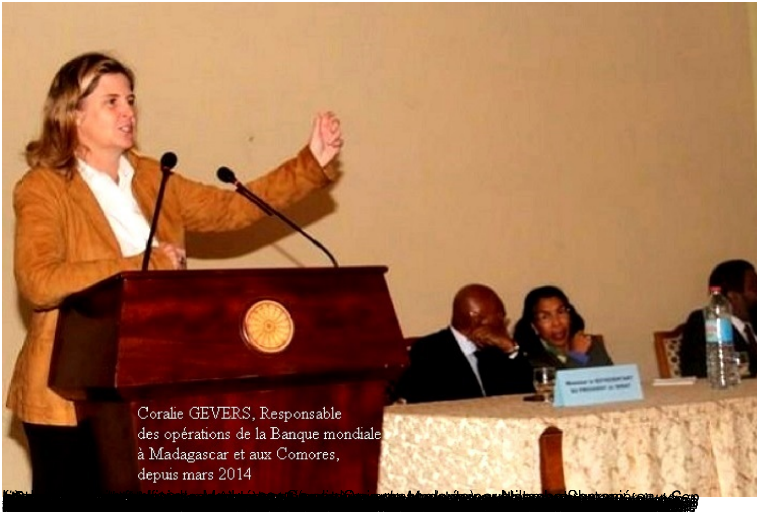
Coralie GEVERS, Responsable des opérations de la Banque mondiale à Madagascar et aux Comores, depuis mars 2014