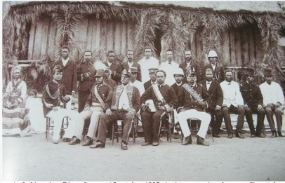
Antsirana, Diego Suarez, 15 octobre 1887. Assis au premier plan au milieu et de

Jeudi, 27 Février 2020 18:25 - Mis à jour Jeudi, 27 Février 2020 18:35