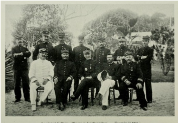
Le général Gallieni, gouverneur de Madagascar. (Photographie de 1914). Gallieni est assis au centre. Image extraite de: Louis Brunet, L'œuvre de la France à Madagascar: la conquête - l'organisation - le général Gallieni,