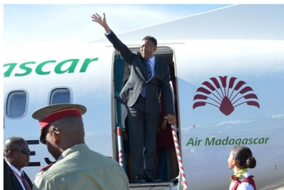
Plus de 30 voyages à l'étranger aux frais des contribuables gogos impénitents malgaches en deux ans de pouvoir

C'est la commune d'Anjapay, dans le district de Tsihombe qui avait été la plus touchée par le Kere, cette année 2016. La réaction du président Hery Rajaonarimampianina, a été tout simplement inqualifiable. Un jour après le citoyen Andry Rajoelina, il est allé, à son tour, dans le Sud, espérant effacer les traces de son ancien patron.