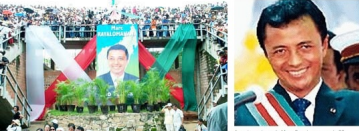
Dakar, Sénégal, 18 avril 2002