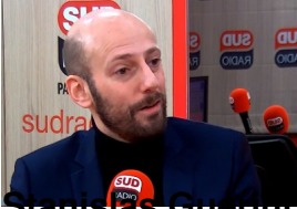
Christophe Guillotin, ministre de la Transformation et de la Fonction publiques ;