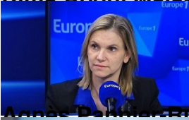
Anne Bernadette Benoit, ministre de la Transition énergétique ;