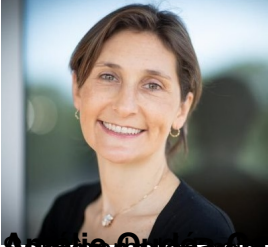
Amélie Oudot, ministre des Sports et des Jeux olympiques et paralympiques.