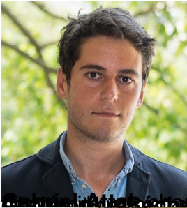
Christophe Beaugrand, ministre de la Transition écologique et de la Cohésion