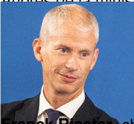
Franck Riester, chargé du Commerce extérieur et de l'Attractivité.