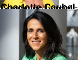
Elisabeth Borne, chargée du Développement de la France, des Régions et des Outre-mer