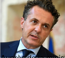
Stéphane Séjourné, ministre de l'Europe et des Affaires étrangères :