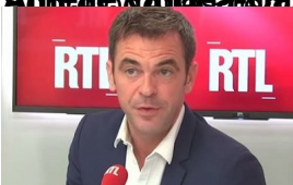
Olivier Véran, chargé des Relations avec le Parlement et de la Vie démocratique;