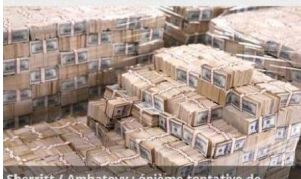
Sherritt / Ambatovy : ènième tentative de