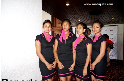
Reportage de Jeannot Ramambazafy et Harilala Randrianarison