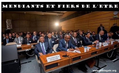
Unesco Paris, 1-2 décembre 2016. Au premier plan, les 7 mendians de haut niveau, au nom du peuple malgache qui paiera toutes les dettes qu'ils auront contractées, sur plusieurs générations. L'Histoire a le devoir de ne pas effacer cette étape de la mémoire collective.

amin'ny mpamatsy vola toa ny nahazatra, hatramin'izay, rehefa miverina ny delegasiona mafonja (ary navoaka amin'ny gazety rehetra fa « nahomby » ny dia ) nefa ny vola tsy eo am-pelan-tànana akory...) fa avy hatrany dia fampiarana. Aiza fotsiny, ohatra ireo hoe vola amina miliara dôlara nangatahin-dry Rajaonarimampianina sy Rivo Rakotovao tao Paris, ny 1 sy 2 Desambra 2016 ? Nisy tokoa ve dia natao inona ?