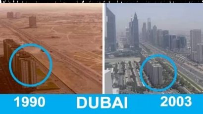
Dubaï est la ville des changements rapides.

https://www.worldometers.info/world-population/madagascar-population/