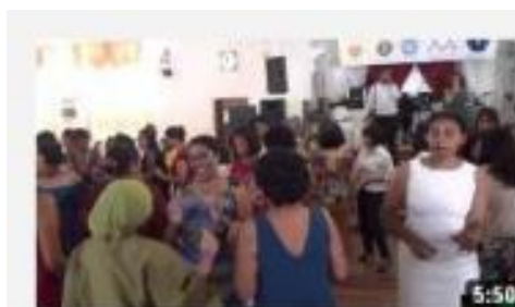
Dames Malgaches Clubs 08 8 mars 2012