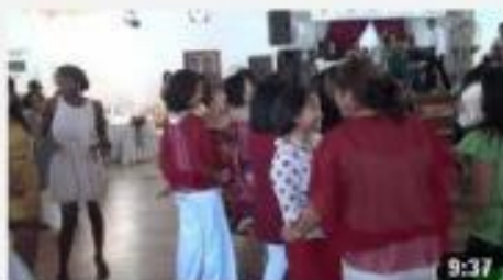
Dames Malgaches Clubs 11 8 mars 2012