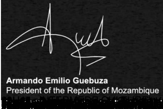
Armando Emilio Guebuza President of the Republic of Mozambique