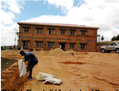
Le 30 avril, la construction de ce qui sera l'Orphelinat