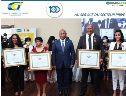
LA VIGNERIE SA 2 e FORDRE NATIONAL (Alain (absent sur la photo))