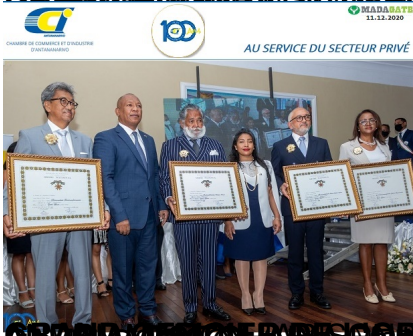
DIRIGENT MAISON COFFEE P&S PREMIER NATIONAL (Andriaka (car décédé le 17 juillet 2020))