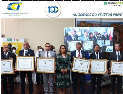
SA FORTISSA 2 e FORDRE NATIONAL (Maurisea)