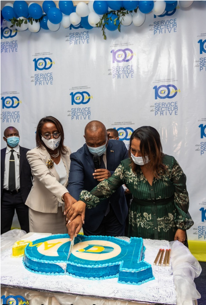
Bossies de JND et GCM Président de l'UNDP et GCM Ambazafy