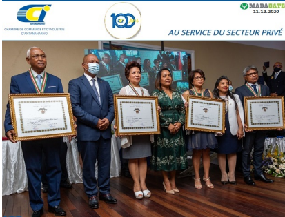
BOITARDIENS SA 2 e FORDRE NATIONAL