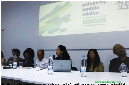
antson'ny tontolo miaina Zone Zitél (à côté du magasin Bébé à bord) du 20 mai au 5 juin Horaires : de lundi au samedi de 11h à 18h30 Dimanche, lundi de pentecôte (29 mai) de 10h à 13h Tel : +261 32 94 099 57 www.madagatc.org